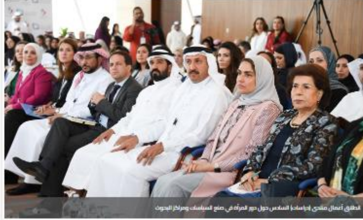
انطلاق أعمال منتدى (دراسات) السادس حول دور المرأة في صنع السياسات ومراكز البحوث

14 يونيو 2023 © وقت الإنشاء: 04:13 PM آخر تحديث: 04:17 PM عدد المشاهدات: 185