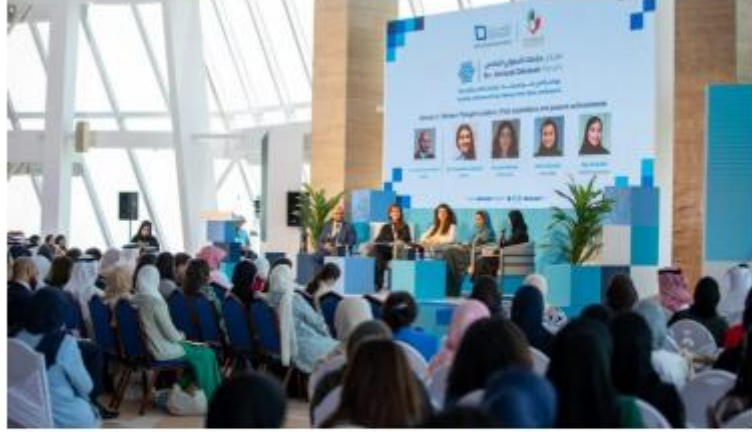
منتدى "دراسات" السادس بمركز البحرين للدراسات الاستراتيجية والدولية

آخر تحديث الأريتمتر 14 يونيو ، 2022 الساعة 22:56 ت القاهرة