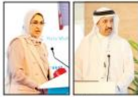
عائلة الأنصاري الشيخ الدكتور عبدالله بن أحمد

الأنصاري: مواصلة الجهود واستحداث أفضل الممارسات لتقدم المرأة البحرينية