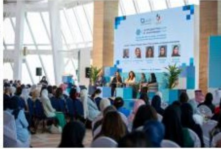
Women Thought Leaders session

National initiatives in the field of women's advancement and governance of gender balance