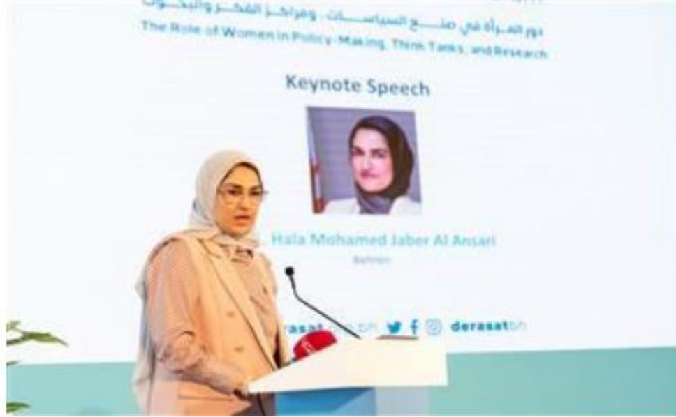
انطلاق أعمال منتدى دراسات السادس حول دور المرأة في صنع السياسات ومراكز البحوث

انطلاق أعمال منتدى "دراسات" السادس حول دور المرأة في صنع السياسات ومراكز البحوث