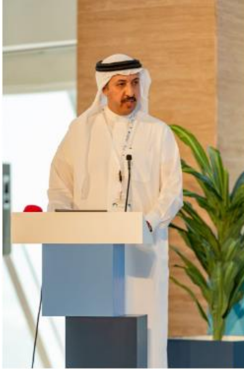
انطلاق أعمال منتدى "دراسات" السادس حول دور المرأة في صنع السياسات ومراكز البحوث