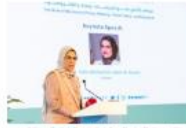
تتحدث د. منى حاتم يمين، أستاذة العلوم السياسية بجامعة القاهرة، خلال المنتدى.

أدت عنوان "دور المرأة في صنع السياسات" - ومراكز الفكر والسياسات، بمشاركة عدد من الخبراء والمختصين.