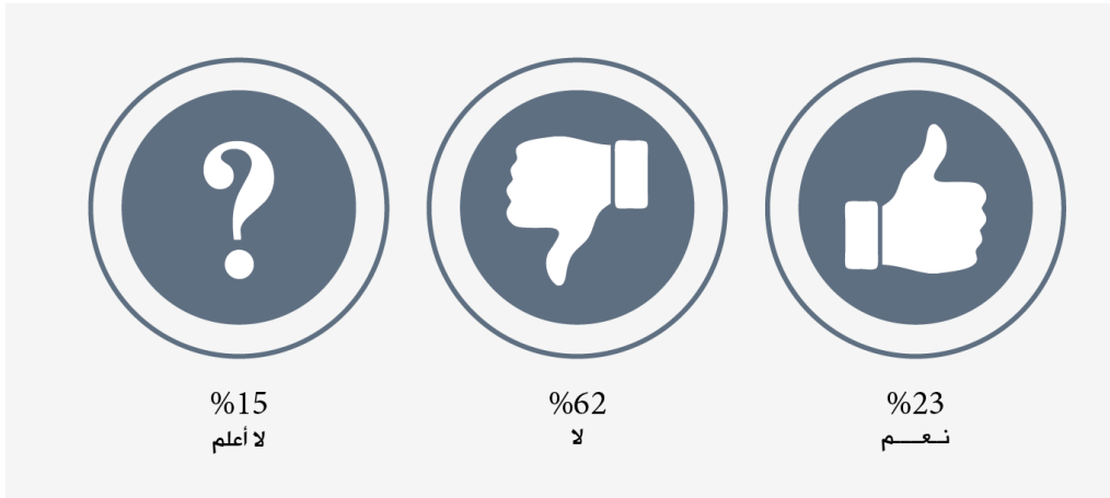
الشكل (1): التوزيع النسبي لإجابات عينة الدراسة حول أسعار إيجارات العقارات

بسؤال أفراد عينة الدراسة بشكل عام عن أسعار إيجارات العقارات اذا كانت معقولة، يبيّن (62%) أن أسعار الإيجارات غير معقولة، في مقابل (23%) صرّحوا بأن أسعارها معقولة.