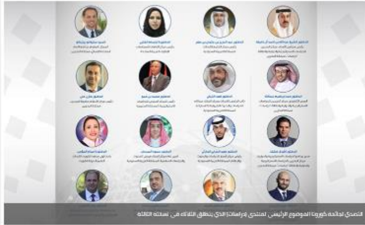
التصدي لجائحة كورونا الموضوع الرئيسي لمنتدى (دراسات) الذي ينطلق الثلاثاء في نسخته الثالثة

22 نوفمبر 2020 @ وقت النشر: 01:56 PM آخر تحديث: 05:41 PM عدد القراءات: 562