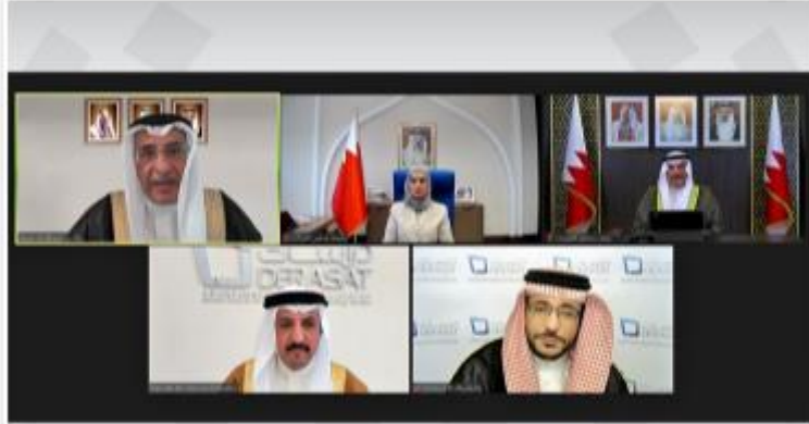
الشيخ خالد بن عبد الله استراتيجياً شاملة لتبوء البحرين المرتبة 25 في مؤشر الأمن العالمي بحلول 2030

21 يوليو 2021 - وقت الرضا: 02:48 PM | ل: تحديث: 04:43 PM | عدد القراءات: 844