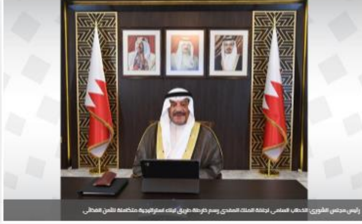
رئيس مجلس الشورى، الخطيب السامي، لجلالة الملك المفدى رسم خارطة طريق لبناء استراتيجية متكاملة للأمن الغذائي

21 يونيو 2021 01:37 PM آخر تحديث: 01:37 PM عدد المشاهدات 324