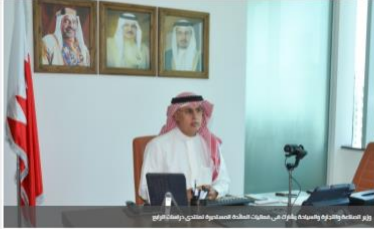
وزير الصناعة والتجارة والسياحة يشارك في فعاليات المائدة المستديرة لمنتدى دراسات الرابع

21 يونيو 2021 • وقت النشر: 12:27 PM • كل تحديث: 12:27 PM • عدد المشاهدات: 376