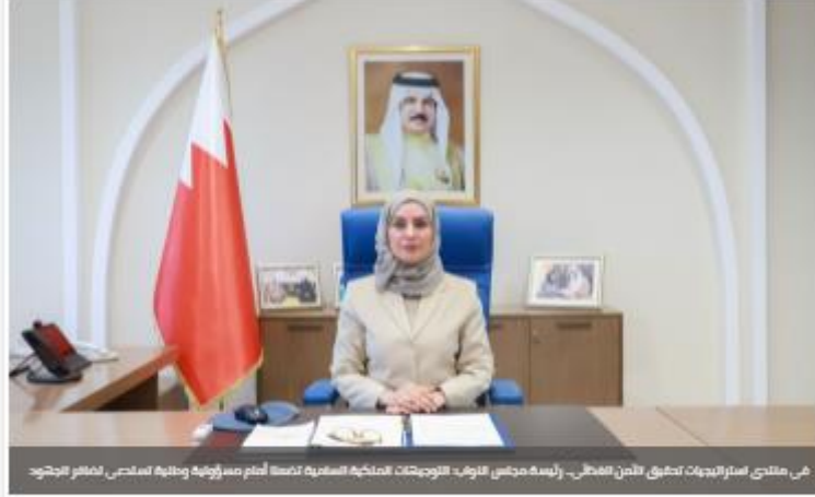
في منتدى استراتيجيات تحقيق الأمن الغذائي.. رئيسة مجلس النواب: التوجيهات الملكية السامية تضعنا أمام مسؤولية وطنية تستدعي تضافر الجهود

21 يونيو 2021 © وقت الإنشاء: 11:48 AM آخر تحديث: 11:48 AM عدد المشاهدات: 406