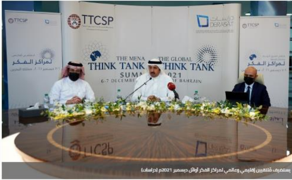
يستضيف مُلتقيين إقليمي وعالمي لمراكز الفكر أوائل ديسمبر 2021م (دراسات)

31 أغسطس 2021 05:38 PM وقت الإنشاء: 05:38 PM آخر تحديث: 05:38 PM عدد القراءات: 255