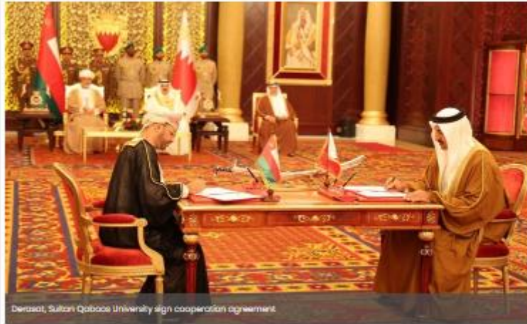
Derasat, Sultan Qaboos University sign cooperation agreement

25 Oct 2022 Created: 12:08 PM Last Updated: 12:10 PM Views: 242