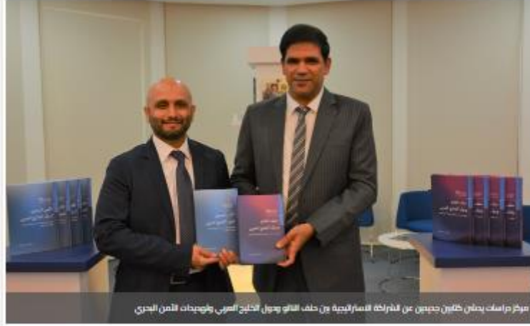
مركز دراسات ي دشّن كتابين جديدين عن الشراكة الاستراتيجية بين حلف الناتو ودول الخليج العربي وتهيّدات الأمن البحري

03 نوفمبر 2022 - وقت الإيفاء: 01:43 PM آخر تحديث: 01:43 PM عدد المشاهدات: 129