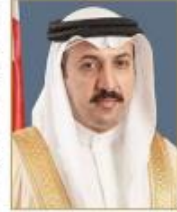
الشيخ عبدالله بن أحمد آل خليفة

أعلن رئيس مجلس أمناء مركز البحرين للدراسات الاستراتيجية والفئوية والطاقة "دراسات"، الشيخ عبدالله بن أحمد آل خليفة، أن نتائج المسح الوطني الذي أجراه المركز حول الانتخابات البلدية والبلدية، والمقرر إجراؤها يوم 12 نوفمبر الجاري، أظهرت حرصاً شعبياً كبيراً على المشاركة في الاستحقاق الديمقراطي، ولتأكيداً واسعاً لممارسة الحق الدستوري في إدارة الشؤون العامة، في ظل فناعة نامة بتشفافية