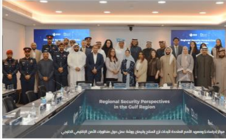
مركز (دراسات) ومعهد الأمم المتحدة لأبحاث نزع السلاح يقيمان ورشة عمل حول منظورات الأمن الإقليمي الخليجي

16 يناير 2023 وقت الإصدار: 11:55 AM آخر تحديث: 11:55 AM عدد المشاهدات: 126