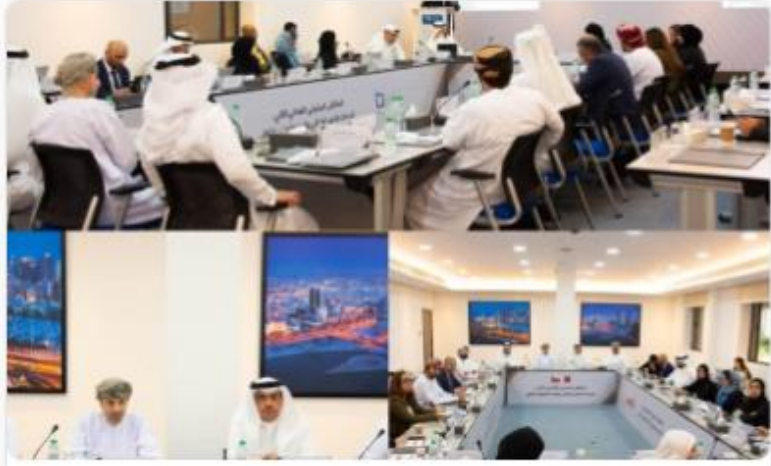
الدمام - فتحيه عبدالله

أقيم "الملتقى البحريني العُماني الثاني" بعنوان "تحديات الأمن الغذائي وآليات التعاون الثنائي لمواجهةها" ، الذي استضافه مركز البحرين للدراسات الاستراتيجية والدولية الطاقة "دراسات" ، يوم الاثنين 13 مارس 2023م بمقر المركز في العوالي، بمشاركة شخصيات رسمية، واقتصادية، ومسؤولين في مجال الأمن الغذائي، وعدد من الأكاديميين من البلدين الشقيقين، بحضور سعادة السفير الدكتور جمعة بن أحمد الكعبي، سفير مملكة البحرين لدى سلطنة عُمان، وسعادة السفير السيد فيصل بن حارب البوسعيد، سفير سلطنة عُمان لدى مملكة البحرين.