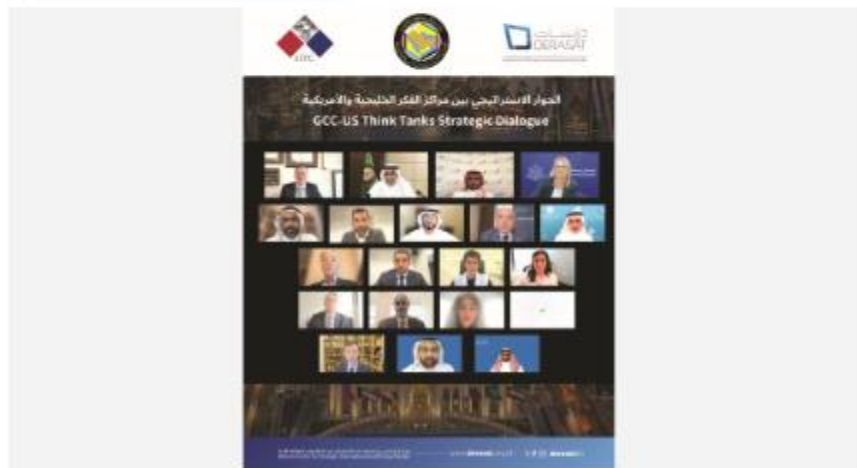
Participants attending the high-level talks remotely yesterday

Iran's unprovoked attacks targeting the security of Gulf states came under the spotlight during the launch of the GCC-US Think Tank Strategic Dialogue yesterday.